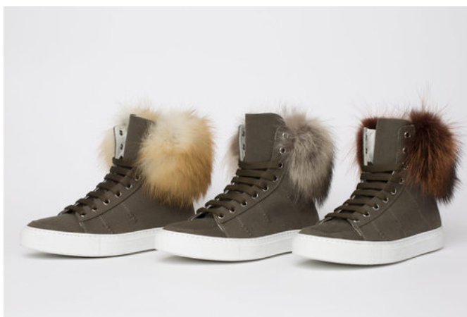
Yves Salomon lance les très chic sneakers à fourrure

La griffe, qui a enrichi son offre ces dernières années pour créer un vestiaire complet, est distribuée à travers 650 boutiques monomarkes dans le monde, ainsi que neuf magasins monomarkes (trois à Paris, un à Saint-Tropez, un à New York, un à Aspen, deux à Moscou et un à Casablanca).